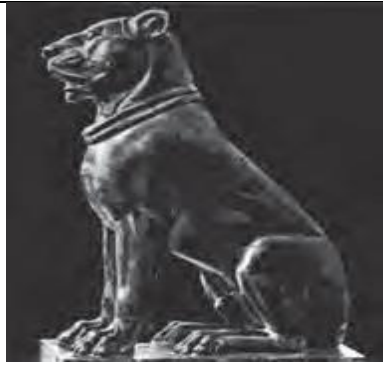
شکل ۴ پیکره شیرسنگی دوره هخامنشی