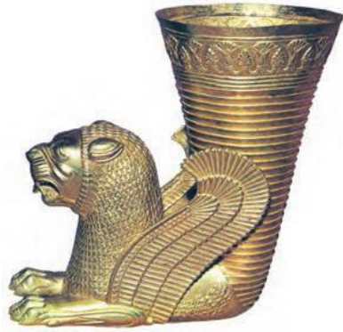
شکل ۶ جام جانوری (تکوک) طلایی، دوره هخامنشی