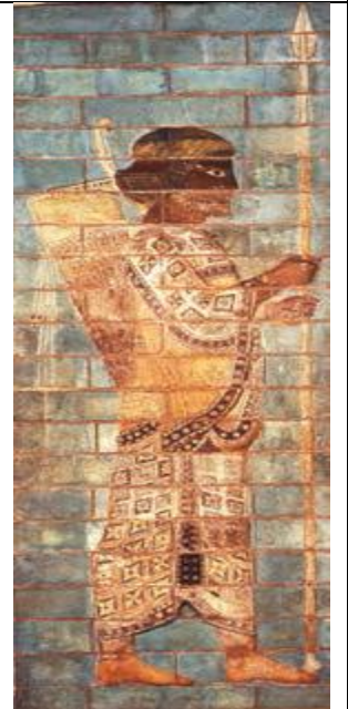
شکل ۷ آجر لعابدار، کاخ آپادانا، شوش، دوره هخامنشی