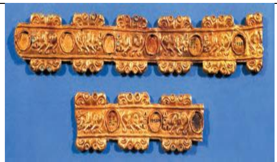
شکل ۱ کمر بند طلائی، گنجینه زیویه، کردستان، هزاره اول پ.م