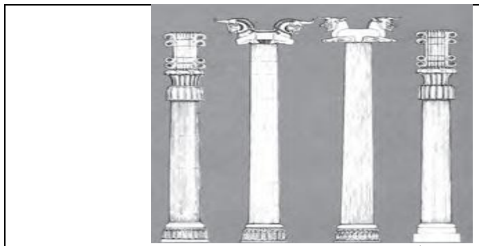
شکل ۲ طرح سرستون های دوره هخامنشی

شماره های ۱ و ۳ و ۵ و ۷ ، تاریخ هنر ایران ، نصرا...تسلیمی و... ، ۱۳۹۴ ، تهران ، شرکت چاپ و نشر کتابهای درسی ایران