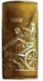
شکل ۵ مهره استوانه ای دوره هخامنشی